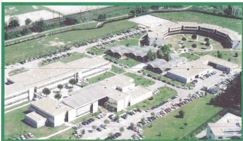
Le CRIP de Castelnau-le-Lez, c'est aussi, une structure pouvant accueillir 280 stagiaires soit, 248 en formation professionnelle, 20 en Préorientation et 12 en UEROS.

De plus, notre engagement en matière de développement durable se poursuit.