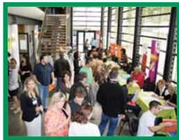
Un public toujours aussi présent

Certains ont décroché un stage, une promesse d'embauche, un contact en vue de leur insertion professionnelle future, en fonction du degré d'avancement de leur formation.